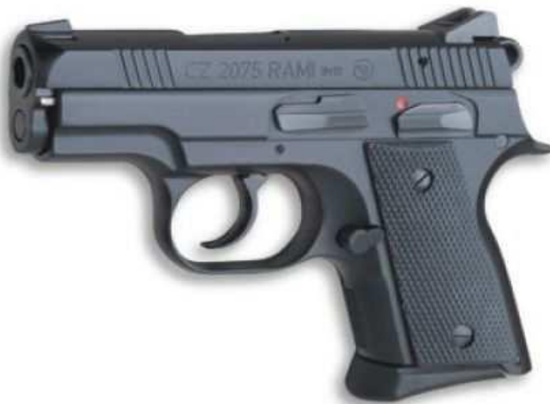
Obr. 2. Krátká palná zbraň CZ 2075 RAMI

V nutných případech podle obchodní smlouvy patří k výbavě fyzické ostrahy krátká palná zbraň. Fyzickou ostrahu se zbraní může plnit jen držitel zbrojního průkazu skupiny D k výkonu zaměstnání nebo povolání.