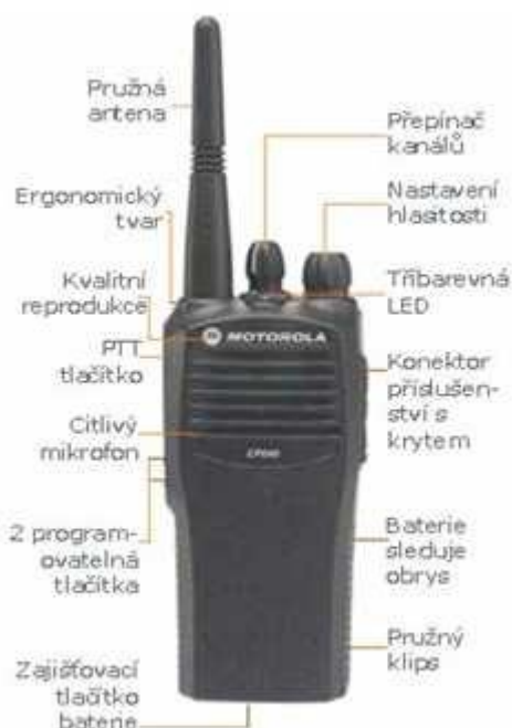
Obr. 12. Radiostanice Motorola