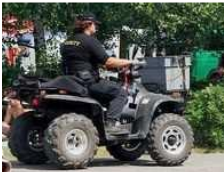
Obr. 13. Fyzická ostraha na mobilní čtyřkolce