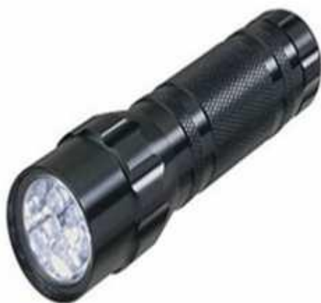
Obr. 8. LED svítilna

Příruční malé a světelně silné jako veliké - to jsou kvalitní LED - kapesní svítilny, které oba tyto atributy efektivně slučují. A díky nákladnému vytvoření masivního - aluminiového obalu má tento světelný zdroj také velikou robustnost a snadno se drží v ruce. Jsou to výhodní průvodci venkovních aktivit, které za to stojí.