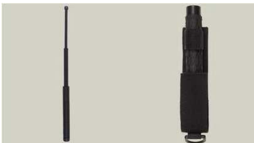
Obr. 4. Vlevo teleskopický obušek vysunutý, vpravo teleskopický obušek v pouzdře

K jedním z „hitů“ poslední doby v bezpečnostním sektoru patří teleskopický obušek. Jde vlastně o poměrně nevelký válec, který se jako zázrakem máchnutím ruky přemění v dlouhou ocelovou tyč. Jen samotné objevení se obušku na scéně může zabránit dalšímu pokračování nebezpečné situace. Typický kovový zvuk, provázející jeho vysunutí už nejednou v reálné situaci odradil některého z agresorů, kteří již obvykle dobře vědí, co taková věc může na jejich těle v „akci“ napáchat.