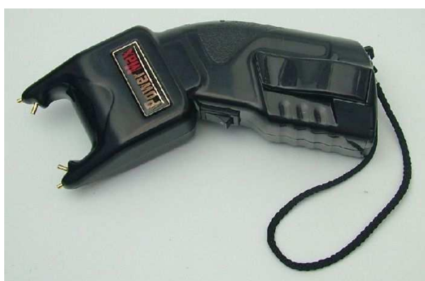
Obr. 7. Elektrický paralyzér

Jde o malý, poměrně lehký kapesní transformátor, který napětí vnitřního zdroje (obvykle 9V baterie) dokáže přeměnit na výboje o síle i několik set tisíc voltů. Kdo si někdy neopatrně sáhl v minulosti do elektrické zásuvky, chápe že nejde o zrovna příjemnou záležitost. Od toho to typu obranného prostředku se ustupuje z důvodu realizace. Elektrody přístroje se musí dostat do kontaktu s tělem protivníka na vzdálenost 1-1,5 cm. To v praxi znamená přiblížit se k protivníkovi a zmáčknout spínač.