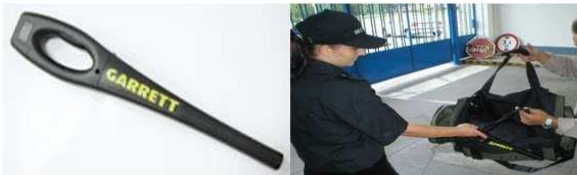
Obr. 9. Vlevo detektor kovů a zbraní, vpravo detektor kovů v akci

0,45 kg, rozměry detektoru šířka 3,20 cm, délka 48,3 cm, Ladění je automatické. Napájení 9 V akumulátorem v provozu vydrží až 80 hodin.