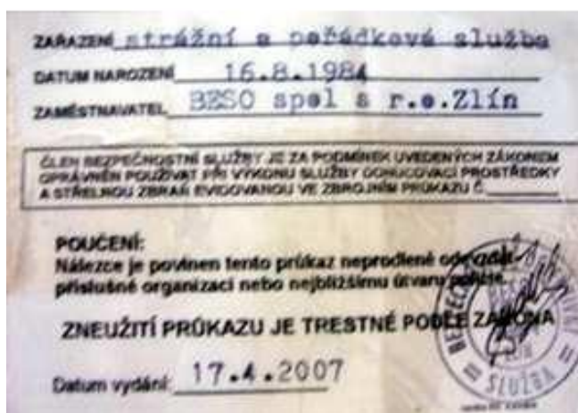
Obr. 1. Služební průkaz