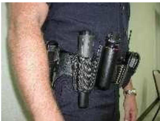
Obr. 11. Detektor Garrett THD v pouzdře na opasku