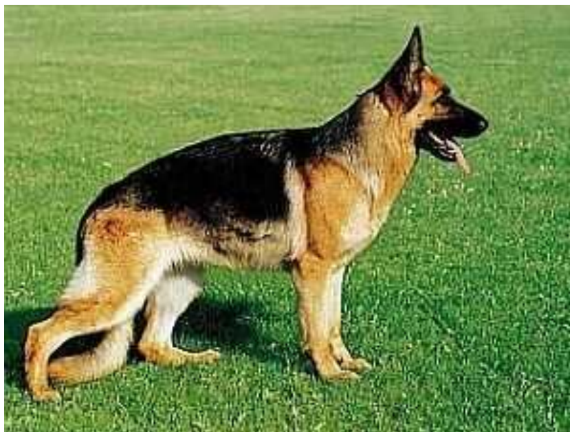
Obr. 15 Německý ovčák – nejčastější plemeno včivku