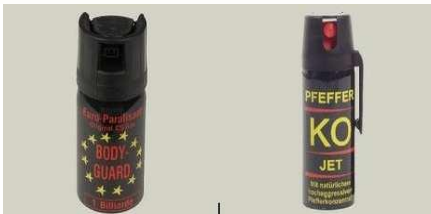
Obr. 6 Vlevo kasr, vpravo pepřový sprej